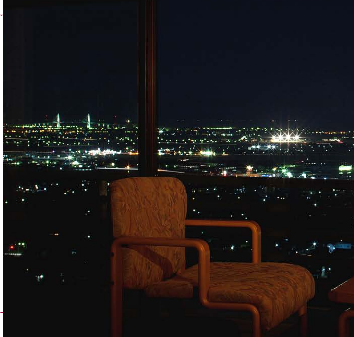
● 夜景が広がるお部屋〈401号室〉