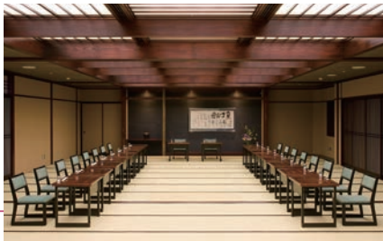
●大宴会場〈しらとり〉

仲間との楽しい宴や 大切な人を偲ぶ法要など 色々な行事や シチュエーションにも利用できるから 呉羽ハイツつて便利ね。