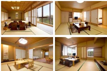
● 多彩なお部屋バリエーション